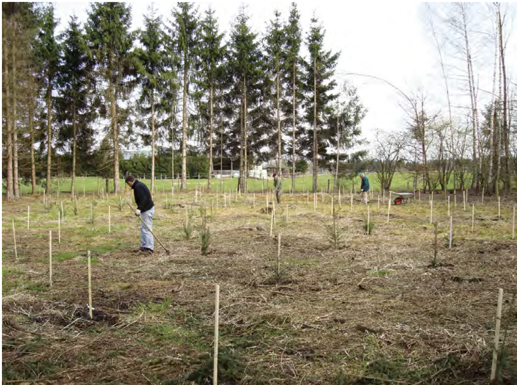
Neuaufforstung im Till (Frühjahr 2010)