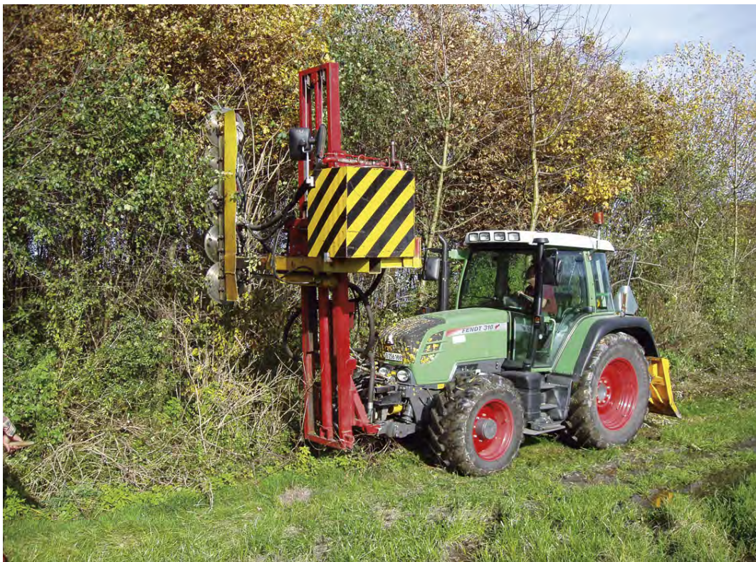
Waldrandpflege im Gstalden (Oktober 2010)