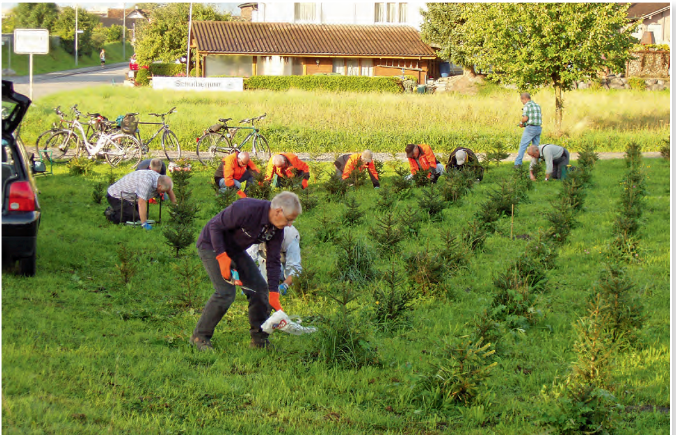
P lege der neuen Christbaumkultur durch Natur60+