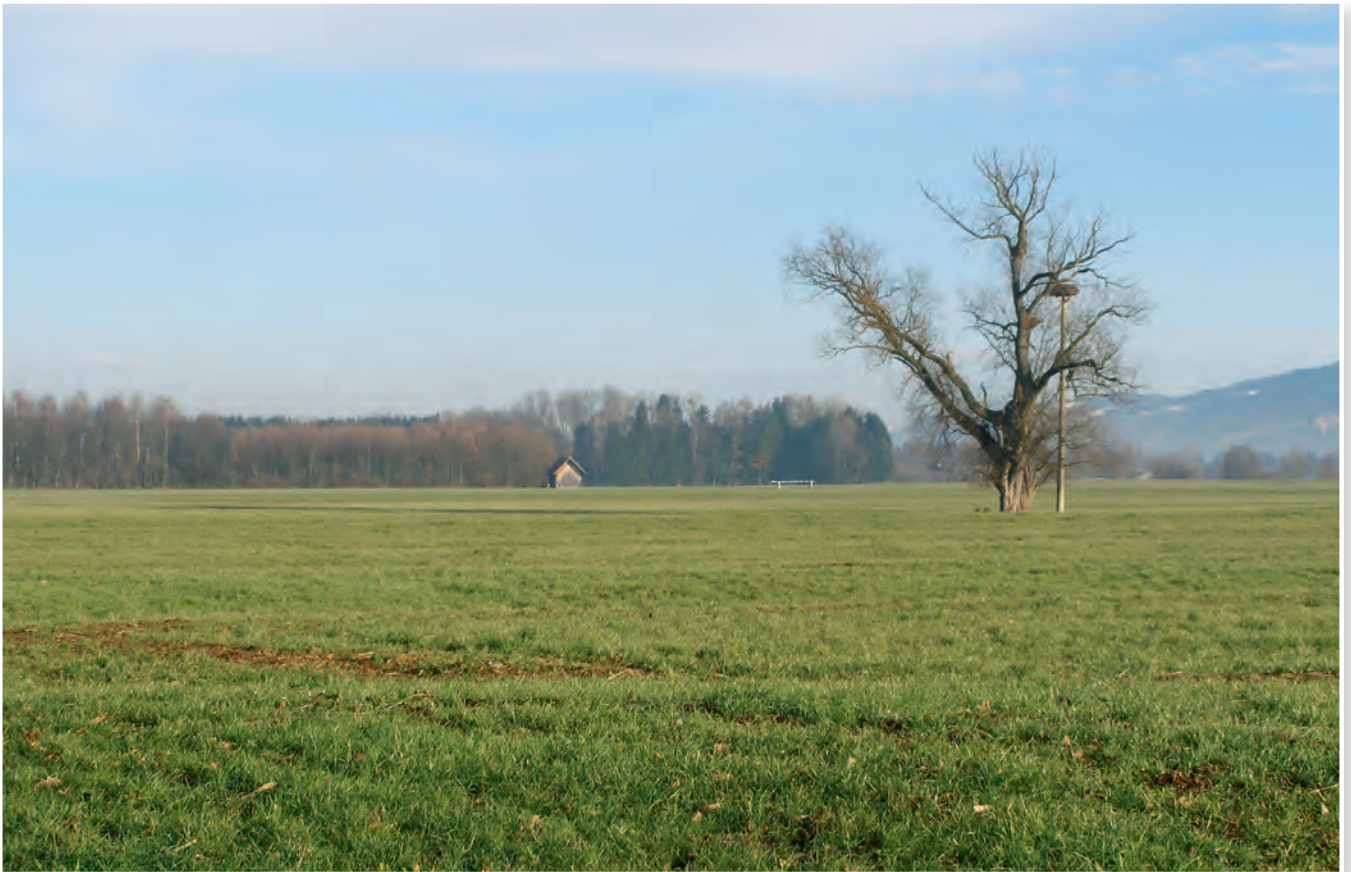
Das letzte Bild der markanten Weide im Gstaalden