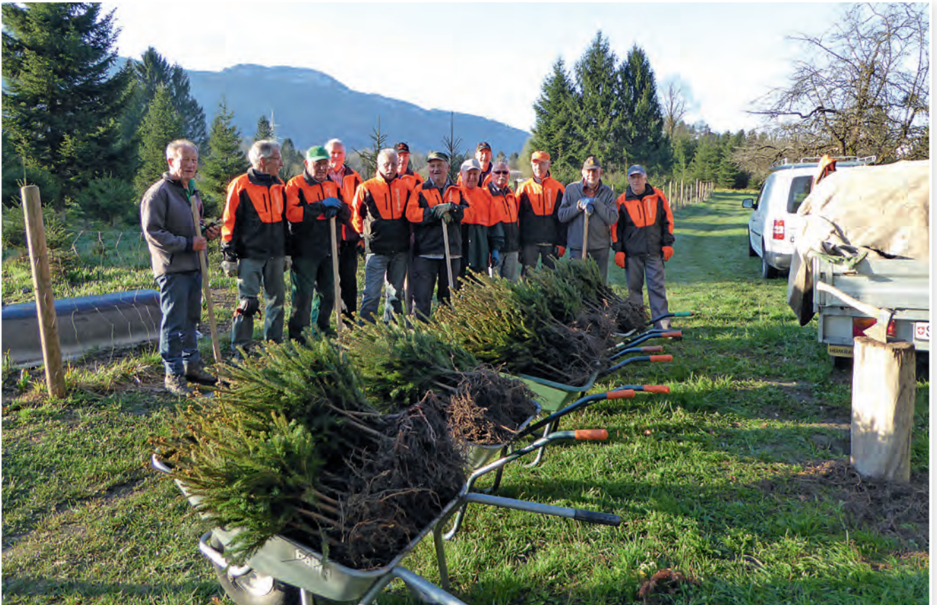
Treue Helfer beim Pflanzen der Christbäumchen: Natur60+