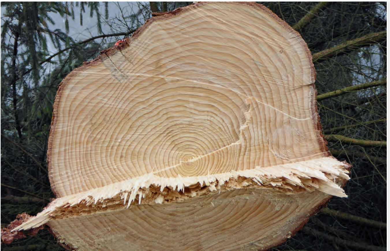
Wie alt ist dieser „Christbaum“ ?