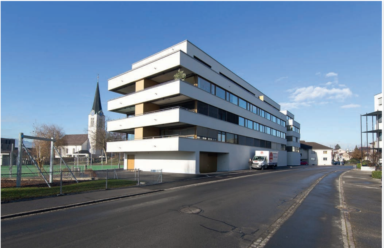
Die neuen Alterswohnungen an der Sonnenstrasse 4 & 6