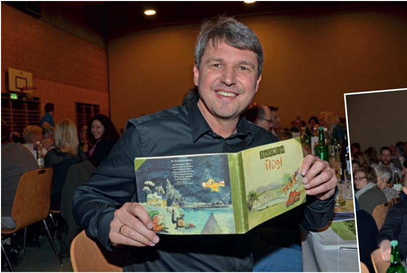
Bürgerversammlung vom 26.2.16