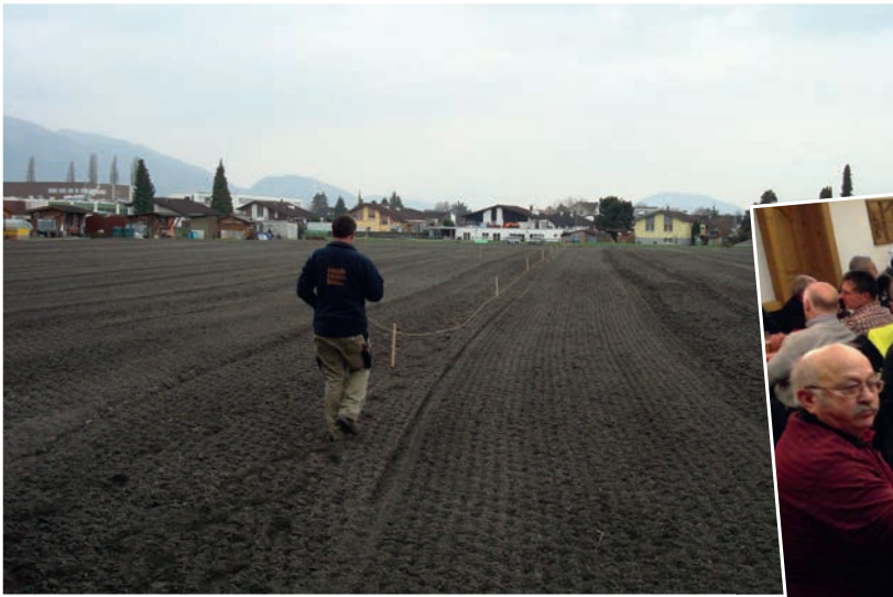
Pflanzgärten / Pächterabend