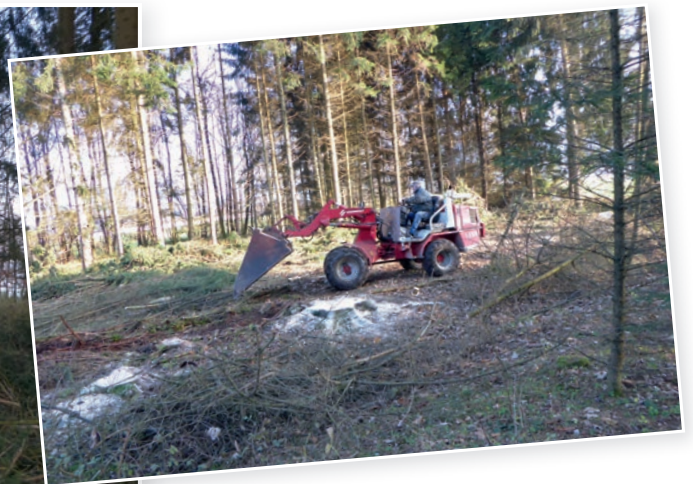
Rodung im Till