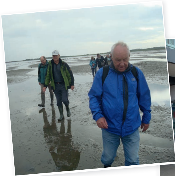
Ausflug nach Wilhelmshaven