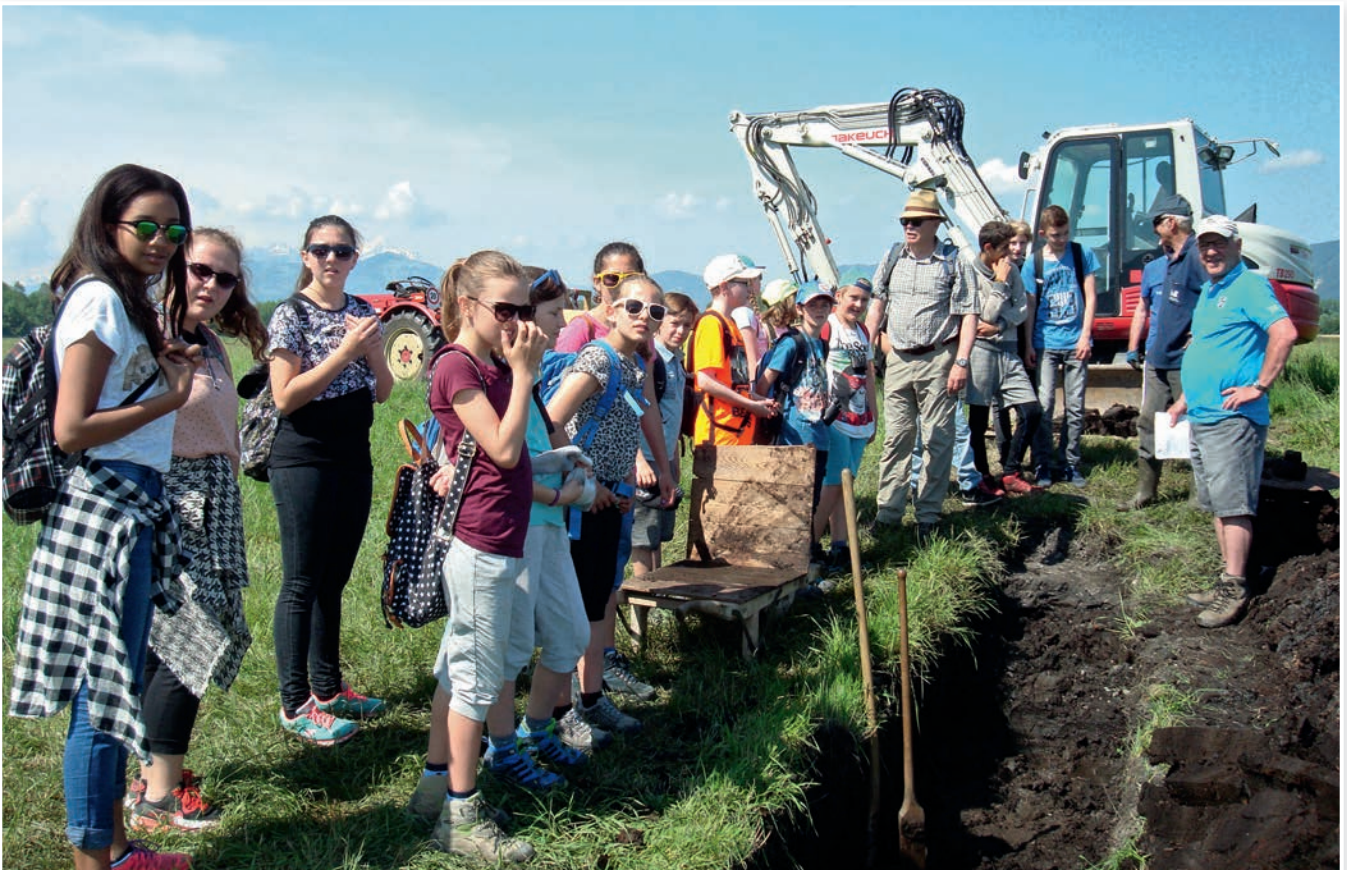
Schülertag 2016 „Schollgraba“ im Hörtli